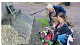
Cérémonie du 11 novembre 2023

Le 11 novembre 1918, est signé à Rethondes l'armistice qui met fin à la Première Guerre mondiale. Une cérémonie commémorative de l'Armistice de 1918 se tiendra lundi 11 novembre à 10h30 au cimetière de Vauhallaan en présence de l'équipe municipale, des anciens combattants et du Conseil Municipal des Jeunes (CMJ).