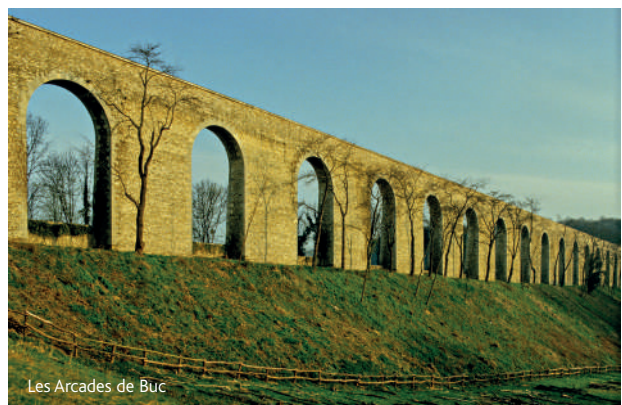
Les Arcades de Buc

Vauhallan à la Une, mensuel municipal d'informations de la commune de Vauhallan ISSN 2801-3220 (version papier) ISSN 2802-2629 (version numérique) 10 Grande rue du 8 mai 1945, 91430 Vauhallan - 01 69 35 53 00 communication@vauhallan.fr